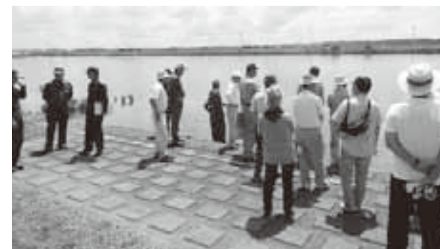
利根川や堤防についてのお問い合わせは 国土交通省 利根川下流河川事務所 金江津出張所 TEL 86-2002

当日は、国土交通省職員による洪水の歴史や利根川の堤防の現状、洪水予報などの説明の後、参加者からは熱心な質問等があり、利根川の堤防について理解を深めました。