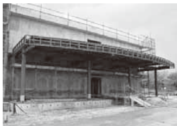
屋根が設置された校舎東側のスクールバス発着場