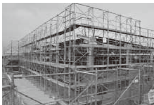
屋内運動場(体育館)の様子