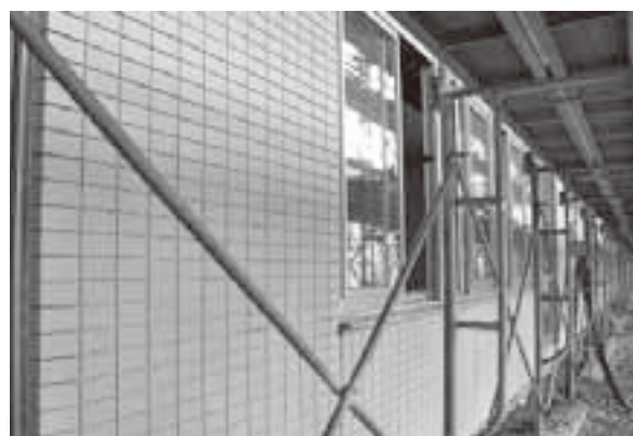
外壁が設置された校舎西側の1階