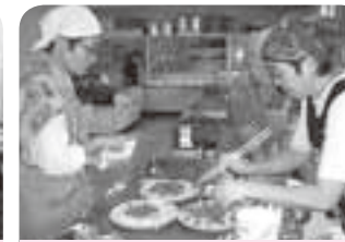
講座では調理実習が4回あり、子どもからお年寄りまでのメニューを作りました。