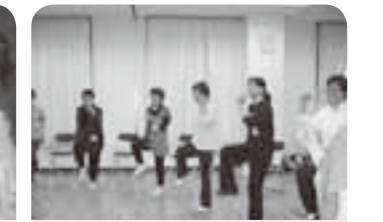
笑いの絶えない運動教室!食事と運動の関連性を学びました。