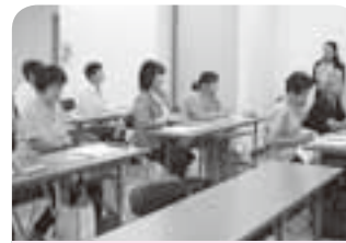
講義さんまの講座初日...初対面の方もいて緊張の1日でした。

講義・栄養計算・手洗い実験・調理実習・運動実習・グループワークなど、全7回の盛り沢山の講座を12名全員乗り切って頑張りました!新しくメンバーになられた皆さんの今後の活躍が楽しみです。