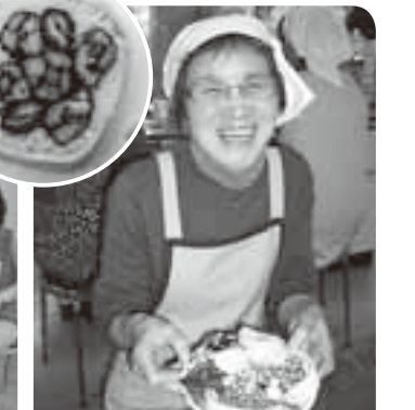
あじさいの太巻き寿司作り!仕上がった太巻きを切った瞬間「キャー!」という歓声があふき起こりました!!

タイトなスケジュールで正直大変だったと思いますが、「自分や家族の食生活を見直す良い機会になり、少しずつ取り組んでいる!」との感想を全員にいただきました。ご参加いただいた皆さん、本当にお疲れ様でした!!