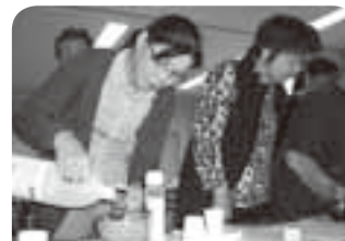
栄養の基礎知識では、醤油などの調味料ごとに大さじを使って量り比べしました。