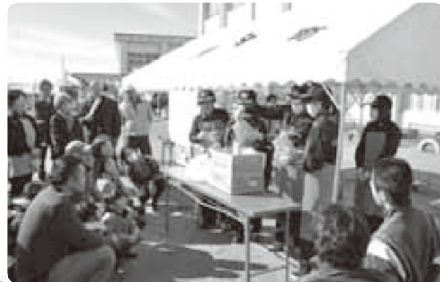
アルファ米による炊き出し訓練