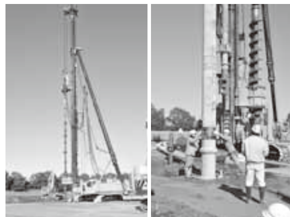
写真：基礎杭打設工事の様子 平成28年1月22日

平成29年4月の統合中学校開校（平成30年度より小中一貫校）に向けて、建設工事が本格的にスタートしました。工事期間中、近隣ならびに公園利用者の方々にはご不便をお掛けすることもあるかと思いますが、ご理解のほどよろしくお願い申し上げます。今後も、「広報かわち」では、建設工事の進捗状況を随時お知らせしてまいります。