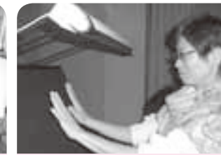
特殊な液を使用して、手洗い実験をしました。洗い残しは、あるかな?