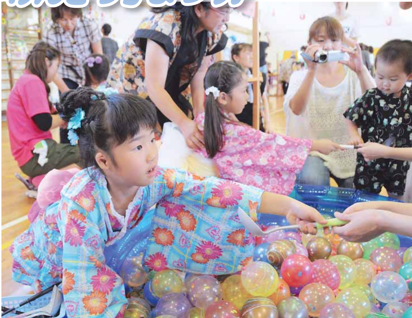
写真：かなえつ認定こども園 「お店屋さんごっこ/ヨーヨーやさん」から