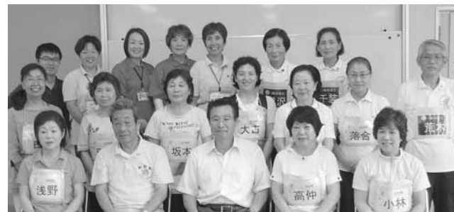
受講者全員で記念撮影