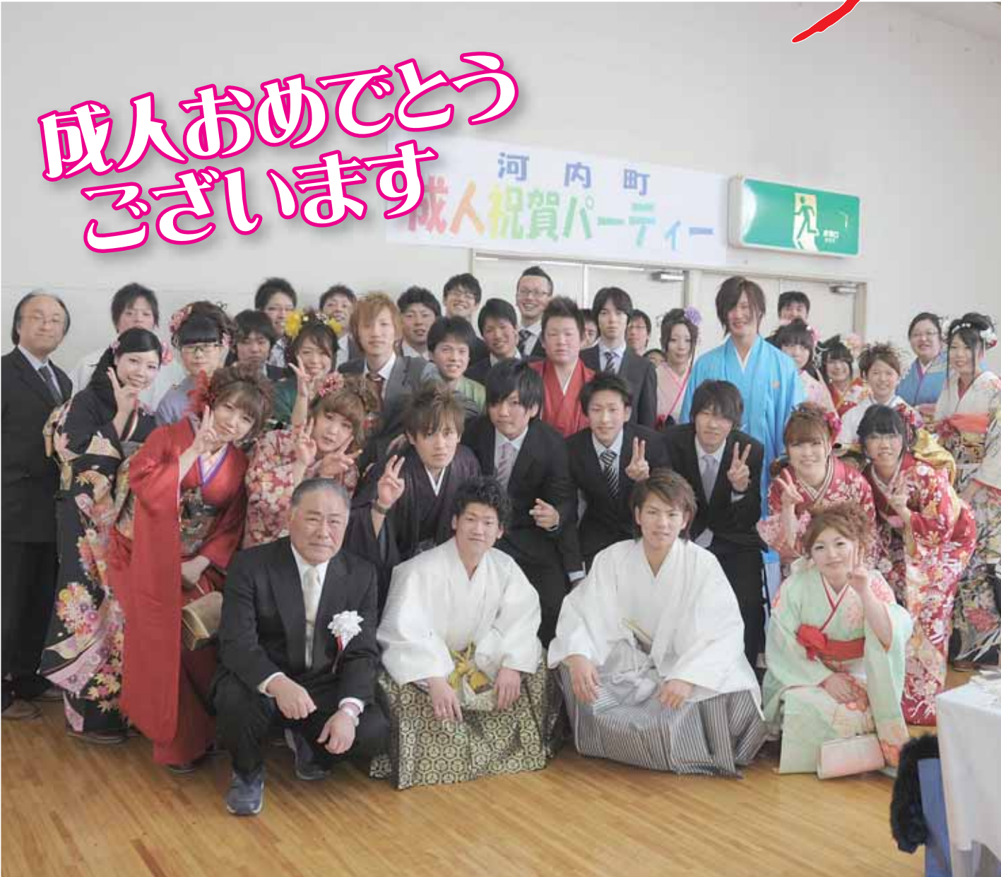
【写真】平成25年成人祝賀パーティーから