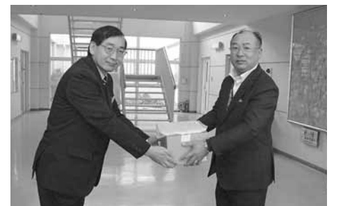
会長から施設の方にお餅が手渡されました