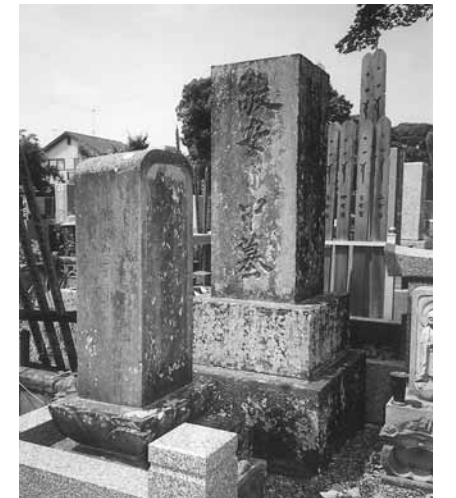
大統寺の高野敬仲の墓

忘れ去られた重要な歴史的事実が、この河内町にも、そんな思いで調べ歩いた。千葉県立関宿博物館の企画展(H16)で「高野敬仲」が取り上げられ、龍ヶ崎市の大統寺にある墓を調べに来たということでその存在を初めて知った。実は高野敬仲は旧生板村早井出身の幕末の眼科医であった。初代敬仲は早井で開業し、江戸の著名な眼科医土生玄碩に学び、関宿桐ヶ作(野田市)、龍ヶ崎で医療を続け、蘭方を学んだ。高野家は4代まで代々敬仲を名乗り、明治30年代、6代で医療活動を閉じた。3代(椿寿)は活動の拠点を利根水運の要、関宿に置き、古河藩家老で蘭学者として有名な鷹見泉石が目薬を取り寄せるほどその名は知られ、赤松宗旦の『利根川図志』2巻に雅号を鳳梧といい絵を好んだと紹介されたほどの人物であった。4代(桃寿)は取手に支店を開き、活動範囲を広めている。高野敬仲は蘭学の最もきびしい時代の人であった。敬仲の母親の墓は早井の「あじさい苑」の近くの田圃のなかにひっそりと建っている。新しい時代への帷はたしかに河内からも開かれていった。