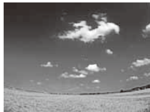
グランプリ作品(河内の夏空)

このコンテストは、河内町の魅力、素晴らしい場所、風景、ヒト、コト、モノ、伝統、文化を広くたくさんの方に発掘、再発見してもらおうと開催されたもので、合計106作品の応募があり、かわちフェスタ等で展示した際の、一般の方々の投票をもとに決定しました。