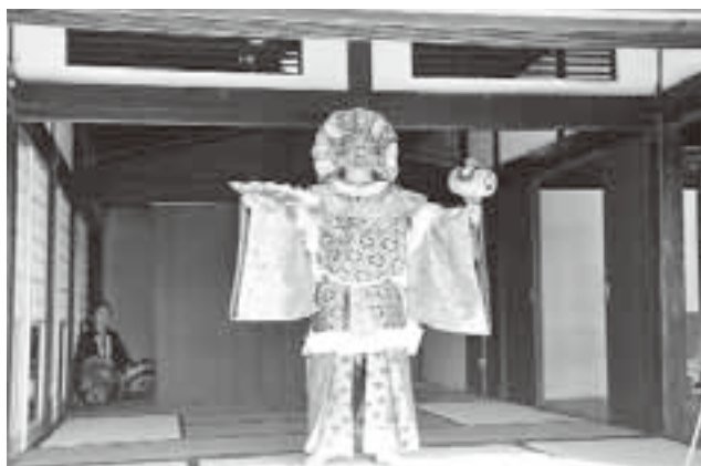
「長竿亭」の発展を祈念して披露された神楽