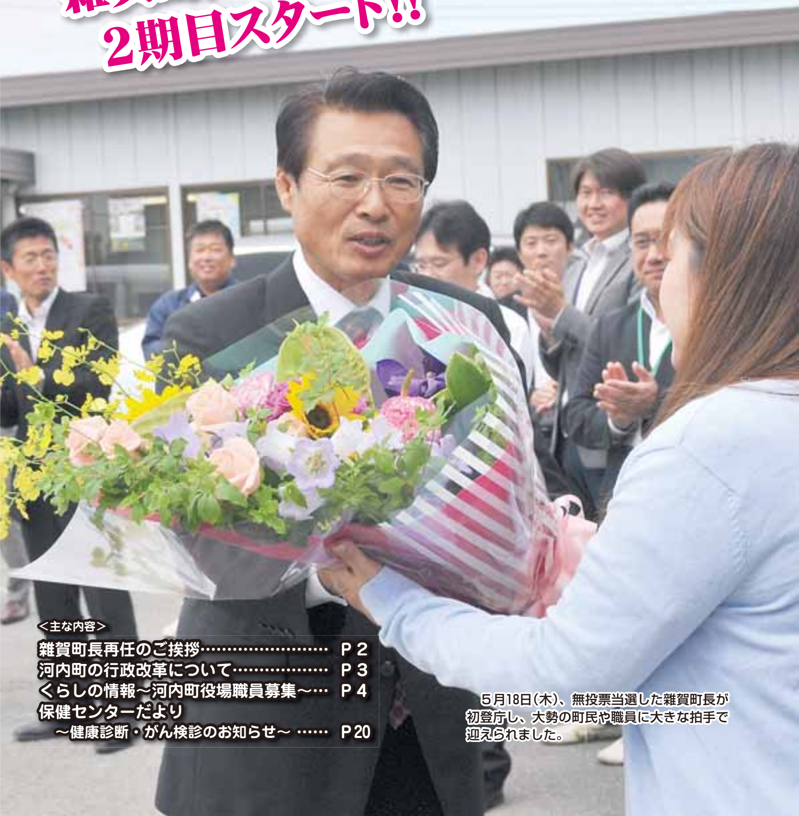
5月18日(木)、無投票当選した雑賀町長が初登庁し、大勢の町民や職員に大きな拍手で迎えられました。