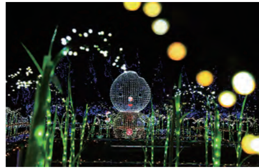
冬には、不動免沼周辺で「かわちイルミネーション」を開催しています。