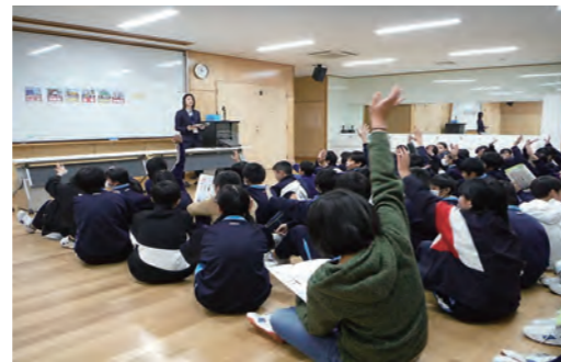
令和元年度 租税教室（かわち学園）