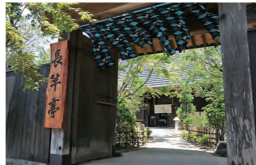
「長竿亭」は、官民共同事業により平成28年12月から「まちの小さな拠点」として再生されました。