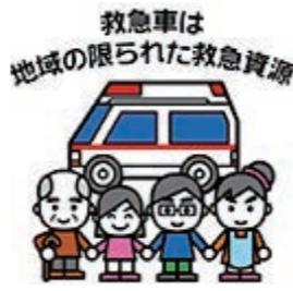
救急車は地域の限られた救急資源