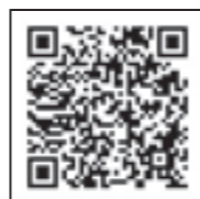
▲マイナポイント事業