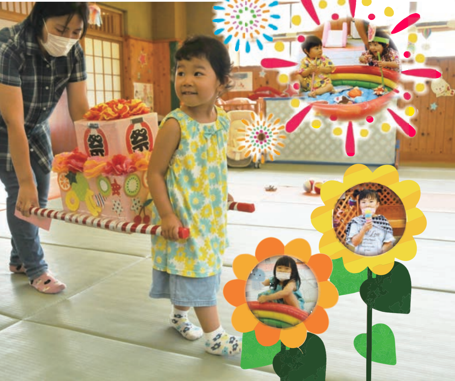
【写真】 子育て支援センター「おひさま」 おまつりごっこより