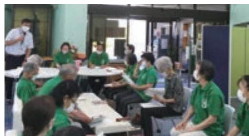
11月18日(金)9:30~12:30 第10回傾聴ボランティア養成講座開催予定。みなさんも受講して一緒に活動しましょう

7月27日に定例会を行いました。常に初心を忘れないために、傾聴ボランティアの約束ごと、傾聴の心得について改めて全員で確認しました。また、コロナ禍での今年度の傾聴活動・定例会・親睦会の開催については、県内の感染状況次第で活動の休止などを検討することとしました。しかし、その数日後に茨城県では4,000人を超える感染者が発表された為、8月と9月の訪問活動は休止とすることに決定しました。10月からの訪問については再び9月末の定例会で話し合います。傾聴ボランティアをご利用のみなさまには、訪問日が決まりましたら直接お知らせに伺います。