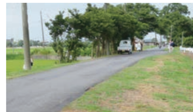
清掃大作戦の様子

参加者の皆さん、ご協力ありがとうございました。今後も私たちの町をきれいにするためご協力をお願いします。