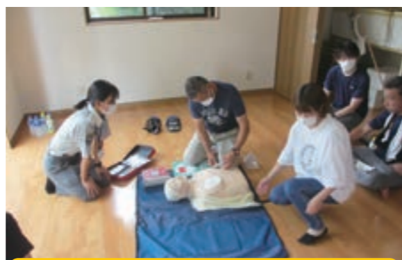
長竿愛宕町地区のAED取り扱い訓練の様子