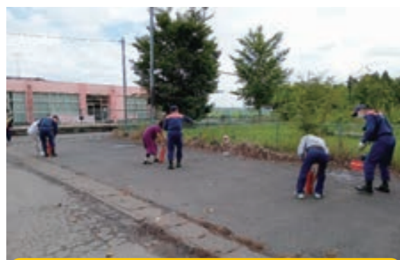
長竿中郷地区の消火器取り扱い訓練の様子