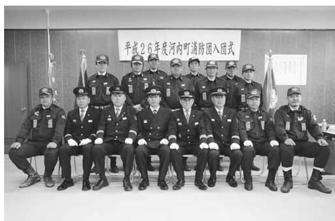
本部役員のみなさん