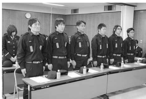
新入団員のみなさん