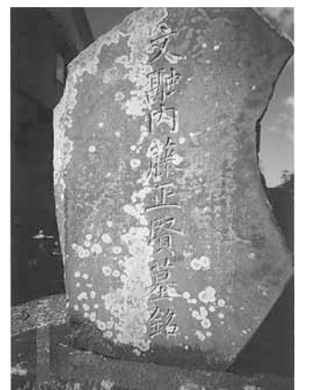
数学者内藤文融墓碑