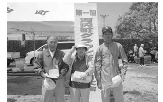
入賞されたみなさん