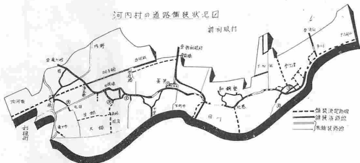
河内村の道路舗装状況図

（上段から） みなさんのご協力をお願いいたします。 道路は、私たちみんなのも のです。道巾など充分に余裕のあるように、構造物や、生き垣などは道路にはみ出さないよう、お願い致します。