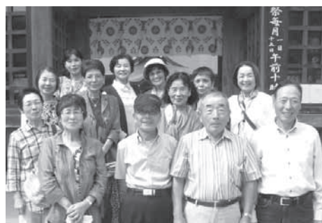
大洗磯前神社にて