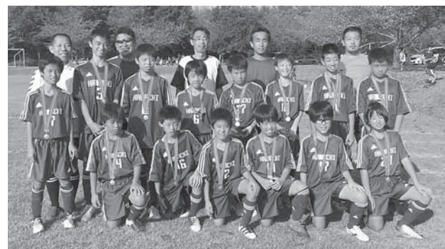
記事提供：河内サッカースポーツ少年団

河内SSSは初日の予選を2位で突破し、翌日の決勝トーナメントに駒を進めました。決勝トーナメントでは、準決勝を逆転で勝利し、決勝に進出。決勝では、両チームとも一歩も譲らずPK戦に突入。10人目のキッカーで優勝が決まりました。これまであと一歩で優勝を逃してきた選手たちですが、優勝が決まった瞬間に見せた選手たちのさわやかな笑顔はとても印象的でした。