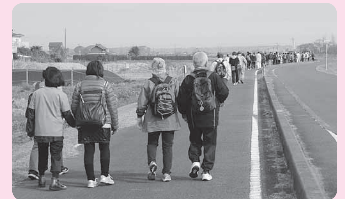
昨年の「歩け歩け会」の様子