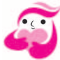
犯罪被害者等支援シンボルマーク ギュっちゃん

◆問合せ先 竜ヶ崎警察署 TEL 62-0110 茨城県警察 性犯罪被害相談「勇気の電話」 TEL # 8103 または 029-301-0278