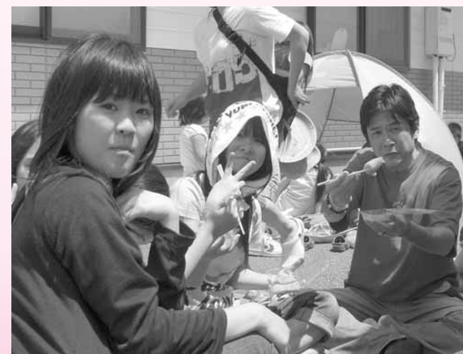
美味しいおにぎり、お餅たべますか?