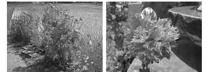
植えてはいけない「ケシ（ソムニフェルム種）」

県では、大麻や植えてはいけないけしの撲滅を呼びかけています。自生や栽培している不正大麻・けしをみつけた方は、最寄りの保健所または警察署までご連絡ください。皆様のご協力よろしく申し上げます。