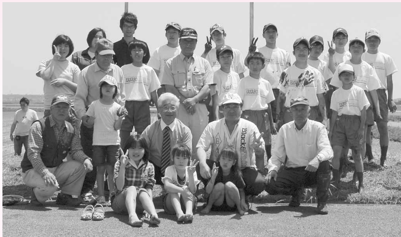
野高町長、福智議長、篠田副議長、美浦の中島村長、保塚地区少年団（東京都足立区）のみなさんと記念撮影