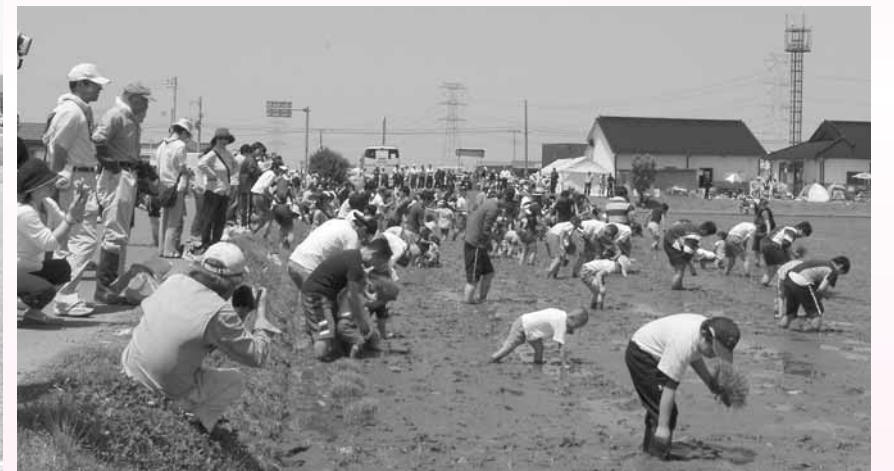
みんなで一斉に田植えスタート!