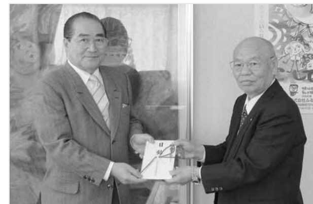
◆目録◆ ・図書教材 稲敷農業協同組合（敬称略）