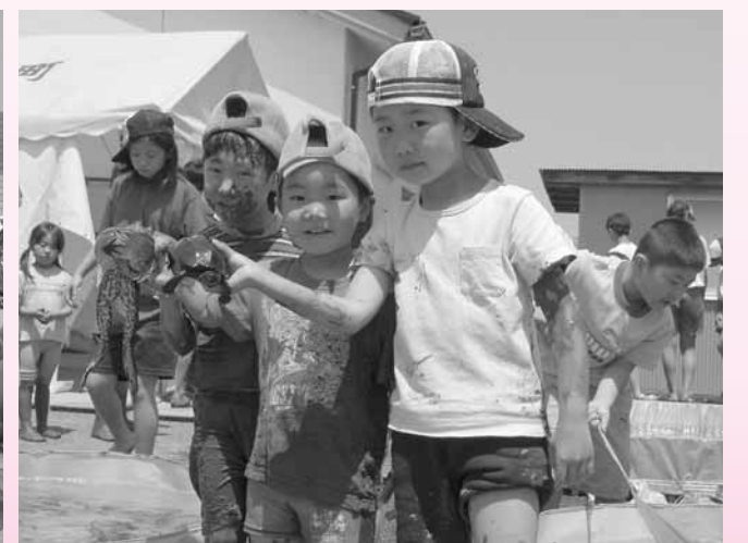
自然がいっぱいの水槽で興奮!