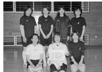
優勝した河内クラブのみなさん