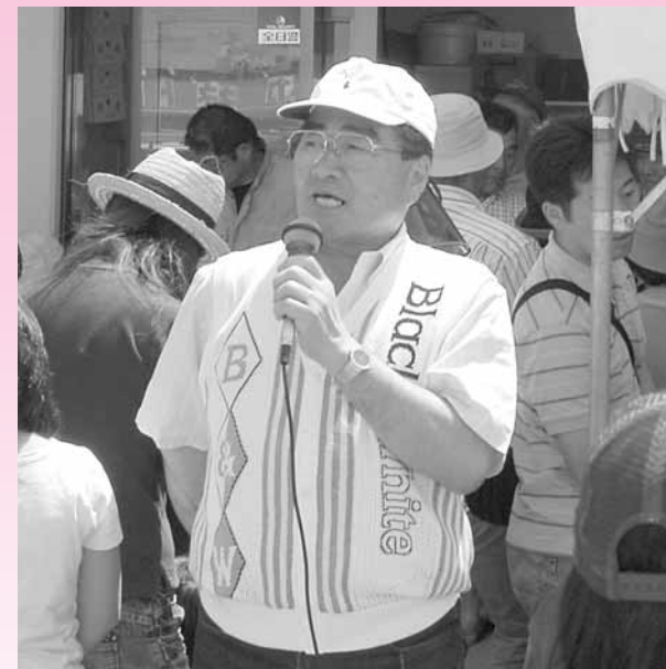
「農業の素晴らしさを楽しく体験してください」