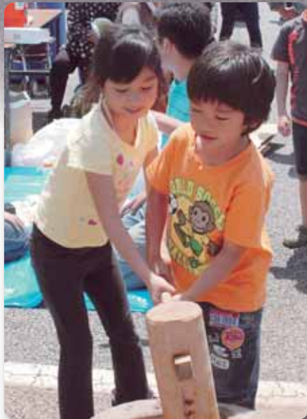
写真:田植え体験祭より