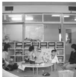
かなえつこども園

主な内容…8日(木)うちわ製作遊び(白いうちに模様を貼ったりして手作りうちわを作ろう。) 13・22日(木)つくって遊ぼう(お子さんと一緒に簡単な物を手作りして使って遊ぼう。) 5・12・26日(月)親子ふれあい遊び(手遊び・お遊戯・体操など…親子でたくさんふれあって遊ぼう。)