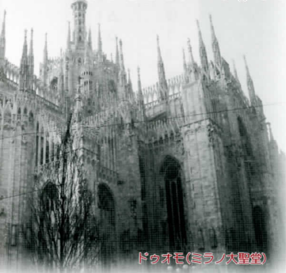
ドウオモ(ミラノ大聖堂)

最後に、両親、祖母、河内町の役員の方々、先生方、JTBの方々、イタリアでお世話になったガイドさんに、心から感謝します。最高の思い出となった7日間をありがとうございました。