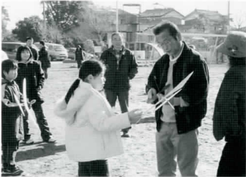
親子で作上げた飛行機が、元気に飛び姿に参加者も感激していました

1月29日(日) 青少年育成河内町民会議主催による『地域ふれあい事業(生板地区)』が開催されました。『地域ふれあい事業』は少子化や家庭の崩壊という言葉を目にするものが多くなってきた今日、子どもも活動や子どもたちの地域活動への参加機会の減少が余儀なくなる中で、自然体験や社会体験・スポーツなどを親子はもちろんのこと、地域ぐるみで実施し、地域一体となって子どもを育てることを目的に、各小学校区で昨年度から実施しています。今回は、生板小学校を会場に、親子で作上げられた手作りの飛行機による「親子模型飛行機 飛行競技大会」が行われ、よい思い出になりました。