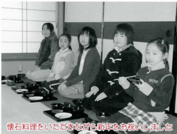
懐石料理をいただきながら新年をお祝いしました

当日は、和やかな雰囲気の中、稽古で学んできた作法で、茶の湯の奥深さを堪能しました。