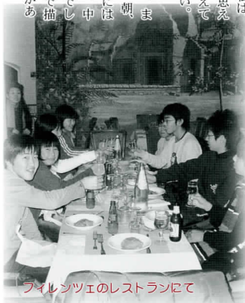
フィレンツェのレストランにて