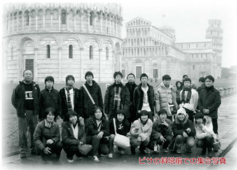
ピサの斜塔前での集合写真

に河内町中学生海外派遣研修事業が開催されました。 14名が参加しました。各中学校の研修生代表の感想文