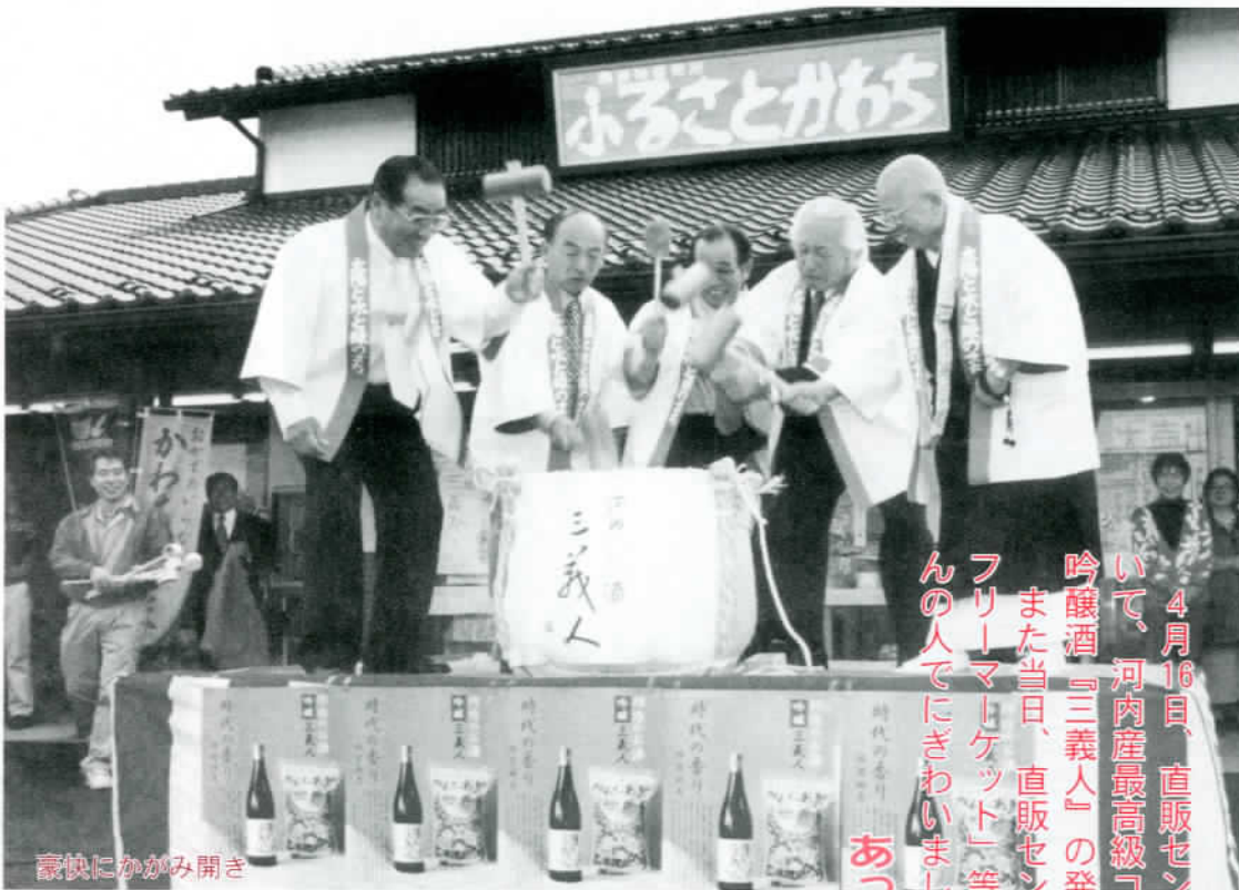
豪快にかがみ開き

4月16日、直販センター「ふるさとかわち」において、河内産最高級コシヒカリを使い新開発された吟醸酒『三義人』の発売披露会が行われました。また当日、直販センターでは「朝市・大売出し・フリーマーケット」等も行われ、朝早くからたくさんの人でにぎわいました。