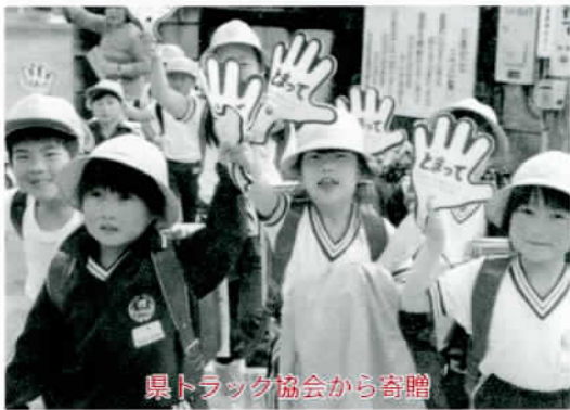
県トラック協会から奇贈