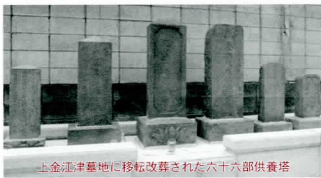
上金江津墓地に移転改葬された六十六部供養塔

果から拾い出してみると、今回の発見をあわせて三〇基のぼり県内でも多い方に入ります。地域的には生板地区一基、源清田地区二基、長竿地区二基、金江津地区一五基となっています。