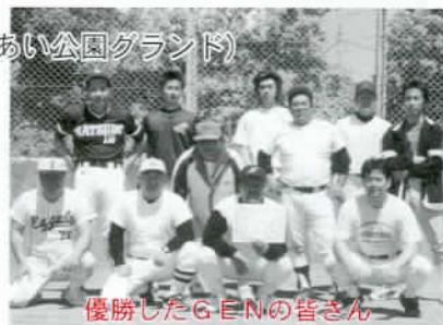
優勝したGENの皆さん