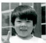
みはら まもる 三原 護くん ウルトラマンガイヤー