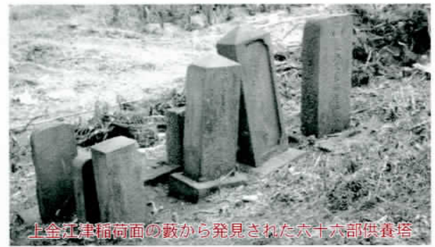
上金江津稲荷面の藪から発見された六十六部供養塔

にはその存在すら知られない大藪の中で長い年月過ぎて来たものと思われる。六十六部、通称六部と言われた廻国行者、世界平和を、人々の幸福を念じ乍ら廻国の果て此の地で命尽きたり、行き倒れて空しく骸を曝したり、謂われの無い差別のため村民と墳墓を同じくできなかつた不幸な人々を葬つたであろうこの塚が人々から忘れ去られて年久しく、一本の野の花すら手向けられなかつたであろうことを思うと感慨深いものがある。碑面を読むと当時の有力者の連名による供養によって建てられ