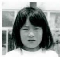
さいが ゆき 雑賀 有希ちゃん セーラームーン