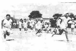
写真は金小運動会