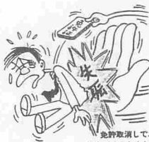
免許取消して、仕事ができなくなる。

所や友人のつき合いがなくなり、家族が経済的に困窮し、一家離散といった最悪の事態に陥るといふケースは、皆さんもよくご存知のとおりです。飲んだら乗るな、乗るなら飲むな。の鉄則を、ドライ