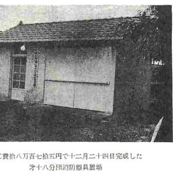
総工費拾八万七千七百五円十二月二十四日完成した