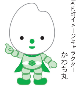
河内町イメージキャラクター「かわち丸」

議会はどなたでも傍聴することができます。 定例会は原則、3月・6月・9月・12月に開催されます。 第2回定例会は6月14日（火）からの予定です。 詳しくは、議会事務局までお問合せ下さい。 ☎ 0297-84-2111 内線 201