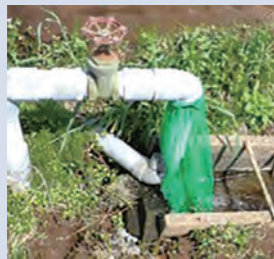
給水栓に収穫ネットの取り付け例