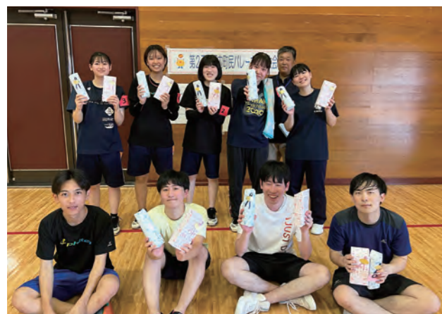
優勝したHINAのみなさん

開催日 7月2日（日） 場 所 河内町農業者トレーニングセンター 結 果 優勝 HINA 準優勝 スカイリバー 第3位 TONE