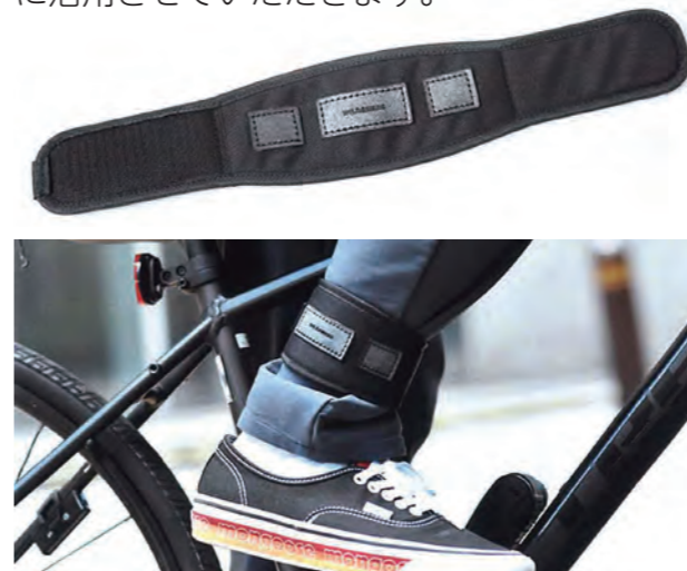
ご寄付いただいたトラウザーストラップ

同社は長竿にアトリエがあり、町のふるさと納税返礼品でもあるWILD SWANSの革製品を製作しています。感謝申し上げますとともにサイクルステーション利用者への貸出等に活用させていただきます。