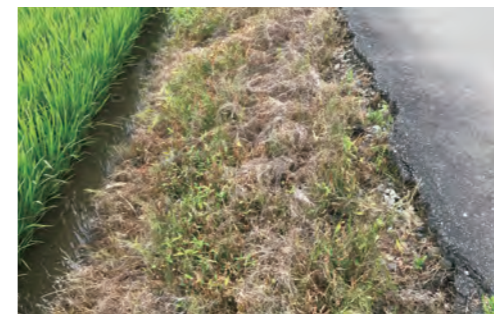
例) 除草剤使用により痩せたのり面