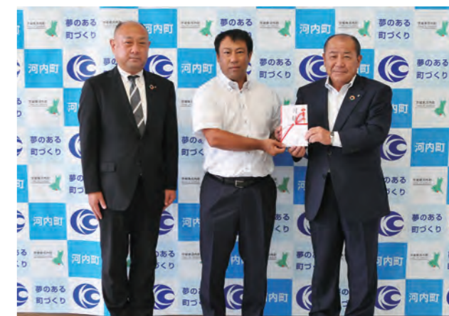
左から常陽銀行松崎支店長、宮本商店宮本代表取締役、野澤町長