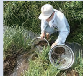
代かき時に流出した断片