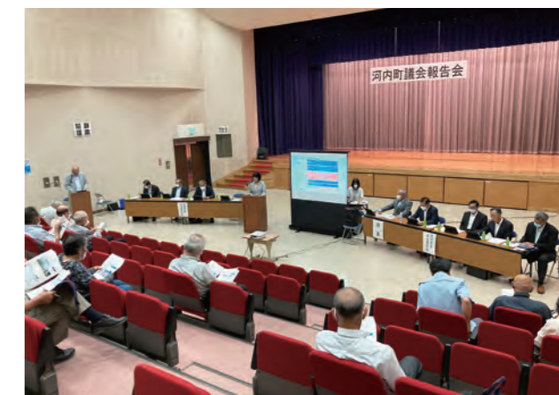
議会報告会の様子

河内町議会より議会のしくみ、議会活動に関する報告を行い、町民のみなさんとの意見交換をしました。意見交換では町民の方々からたくさんの貴重なご意見をいただきました。