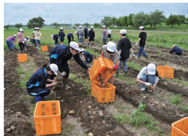
ジャガイモ収穫の様子