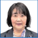
星野 初英 議員