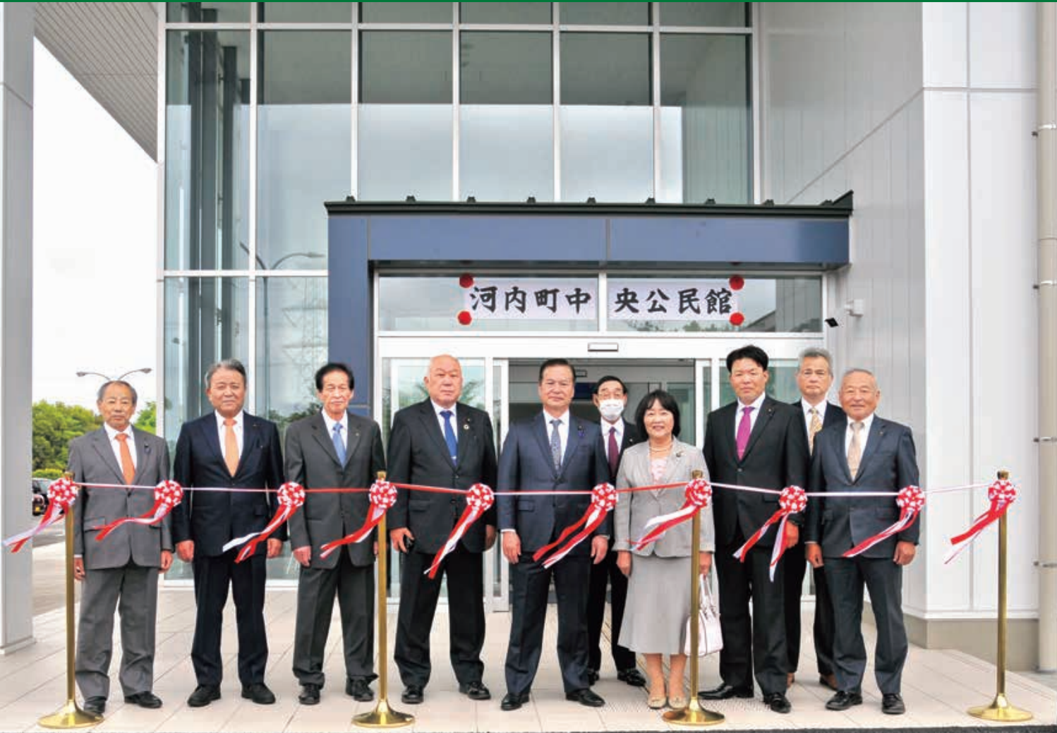
写真：中央公民館竣工式