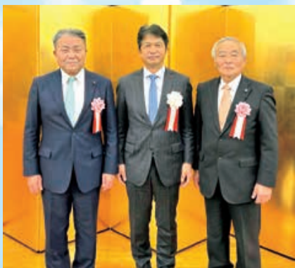
写真(左から) 服部議員 大井川知事 牧山議員