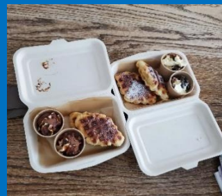
キッチンカー シーズ