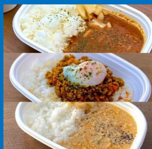
トラベリング・カレー